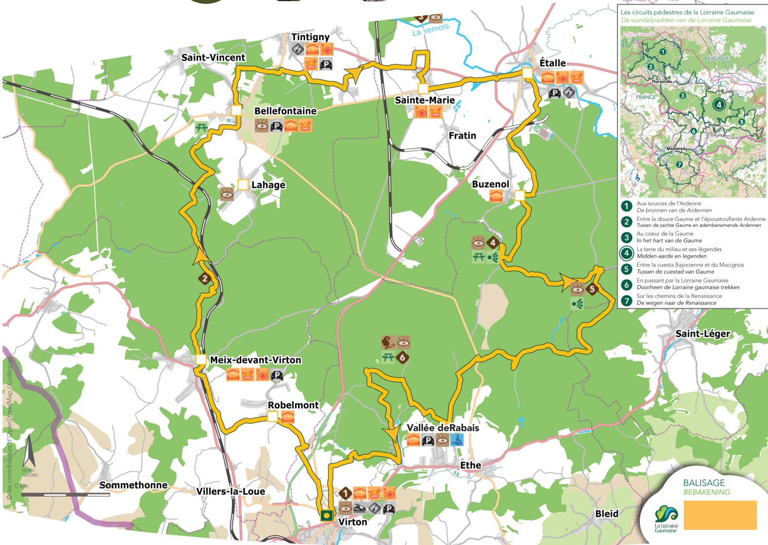
Les circuits pédestres de la Lorraine Gaumaise De wandelpadden van de Lorraine Gaumaise